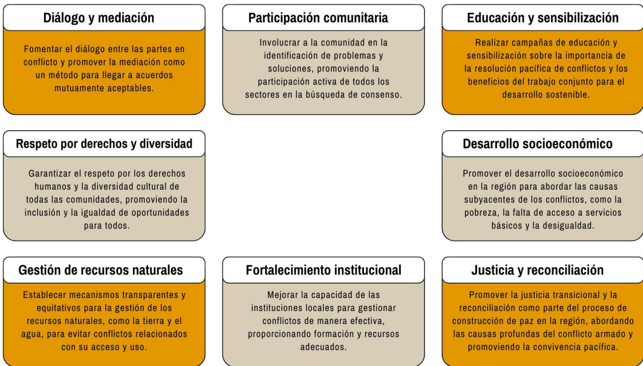
Figura 2. Propuesta de medidas de mitigación y resolución de conflictos en el departamento del Guaviare.