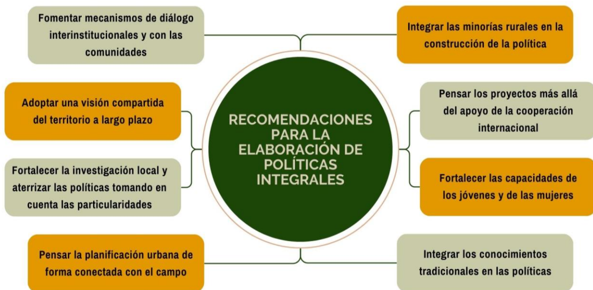
Figura 4. Resumen de las recomendaciones de la mesa de discusión “Políticas integrales”.

La mesa de discusión sobre políticas integrales enfatizó una serie de recomendaciones para la elaboración de políticas públicas que adopten un enfoque integral (Figura 4).